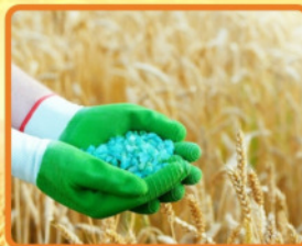
Оптовая торговля удобрениями