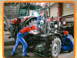
Ремонт и комплексное техническое обслуживание сельскохозяйственной техники